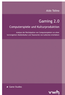
Aldo Tolino vwh Verlag Werner Hüls- busch, Boizenburg/D 2010