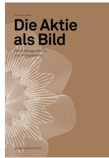
Irini Athanassakis SpringerWienNewYork 2008